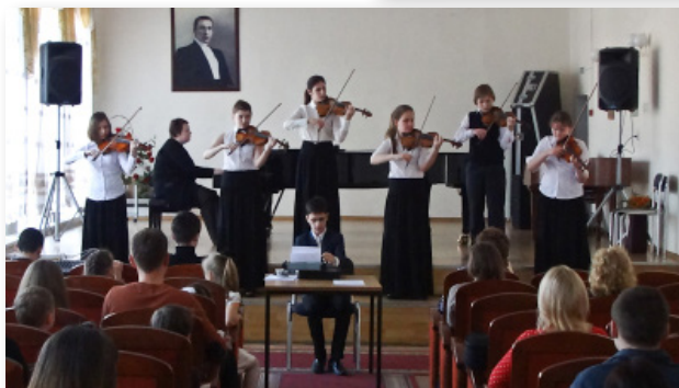
29 марта 2014. Большой зал колледжа. Ансамбль скрипачей ДМШ