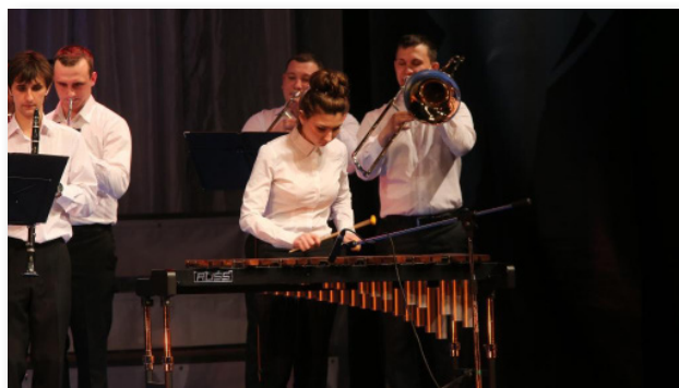
21 апреля 2014. Областной драмтеатр. Студенческий духовой оркестр