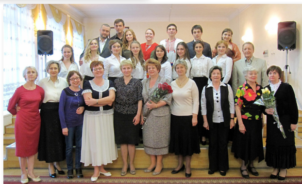
29 апреля 2014. Большой зал колледж. Отчетный концерт отделения «Вокальное искусство»