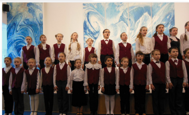
12 марта 2014. Музей Мирового океана. Хор старших курсов ДМШ.